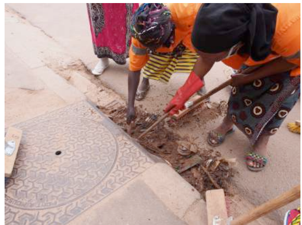
Photographie prise à DALOA Côte d'Ivoire, les femmes balaiant la rue mais les bouches d'égout sont bouchées.