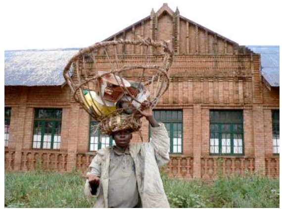
Tri du fer : Les enfants trient les poubelles, ils cherchent le métal.